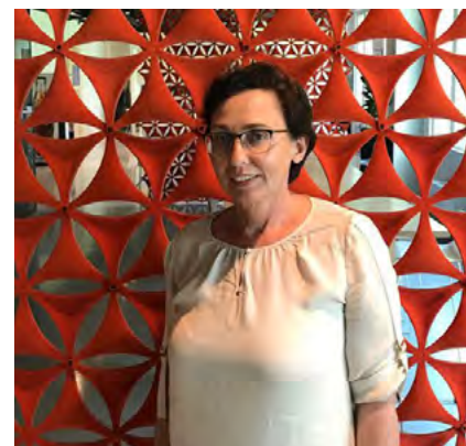
An Boone Coördinator UNIZO O&O

Heel veel succes ermee! We wensen je een super ondernemend schooljaar toe . Heb je tips, tricks, input, vragen ... aarzel niet om ons dit te laten weten. We ondersteunen jou waar mogelijk.